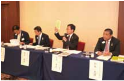
辻川キャビネット幹事よりライオンズクラブの手引き等のホームページの活用を説明して下さいました。