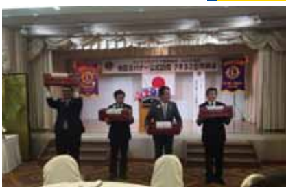
地元のゾーンより記念品贈呈