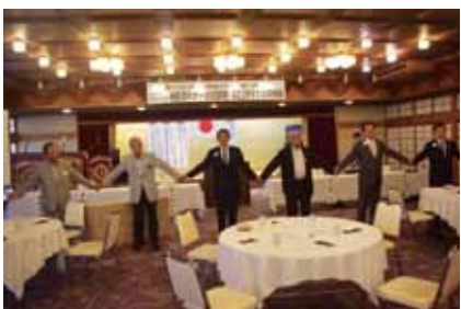
協力しあって頑張ってます!!(田中地区 GST 委員)