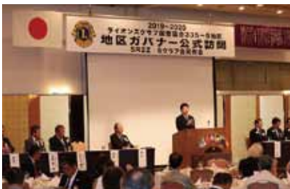
各クラブ会長の意気込みが感じられ、厳しさの中にも和気あいあいとして、会員拡大への決意が伝わってくる例会でした。