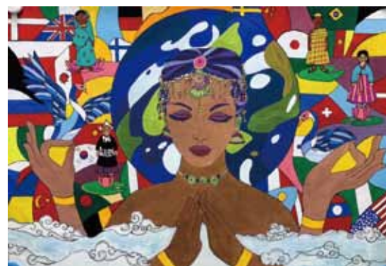
高槻グリーン LC 高槻市立南平台小学校 角 香杜実さん

佳作 35 作品については地区ホームページをご覧ください。 http://www.lc335b.gr.jp/peace_poster/