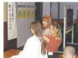
大阪ピースライオンズクラブの会合でヘアドネーションのために髪を美容師に切ってもらった参加者。20日、大阪市内。

病気などで髪を失った子供たちにウィッグ（かつら）を贈るため、髪を寄付するボランティア活動の「ヘアドネーション」が大阪で広がりを見せている。