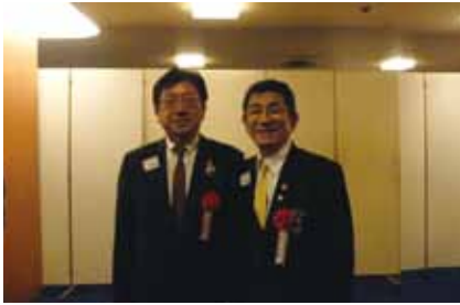
始まる前の和やかな表情のL田中とL中谷